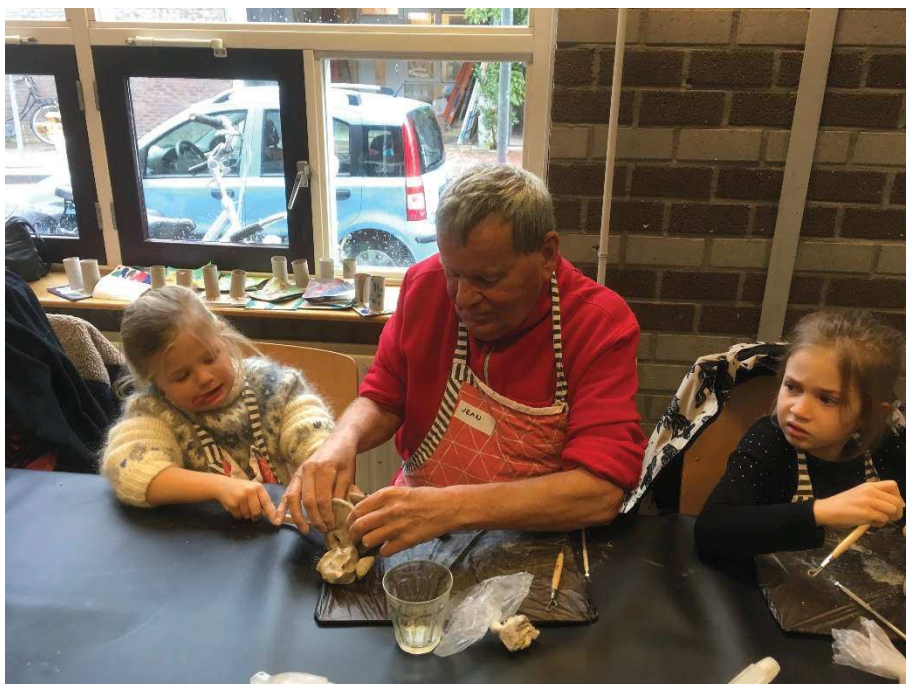
Samenwerken op een basisschool

Verder is er maatschappelijk werk gericht op het ondersteunen van cliënten in de thuissituatie. Dit varieert van bemiddeling bij het zoeken naar een geschikte woning, het verzorgen van de aanvraag van een begeleiderskaart openbaarvervoer tot ondersteunende gesprekken bij het verlies van een partner of bij de verwerking van problemen bij slecht zien. Ook worden feestdagen gezamenlijk gevierd. Verder geven de medewerkers informatie op vele terreinen. Het eigen werk richt zich in de praktijk vooral op blinde en slechtziende volwassenen waarbij de groep ouderen (boven een leeftijd van 75 jaar) het grootst is.